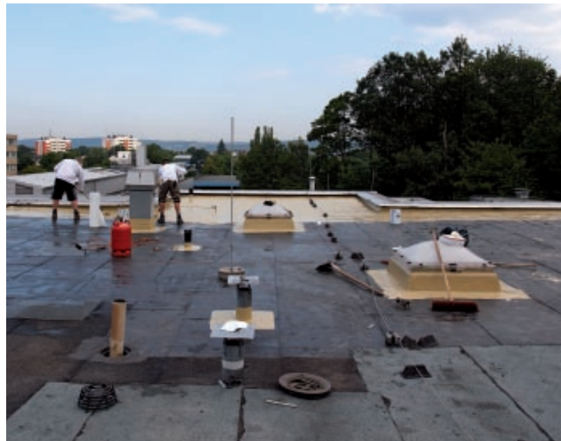
Ansicht der Dachfläche während der Instandsetzungsarbeiten.