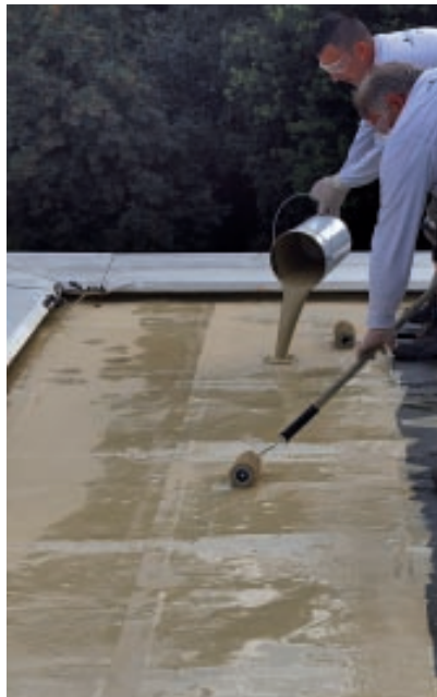
Verarbeitung in der Fläche: KEMPEROL® wird vorgelegt, das Armierungsvlies eingerollt und mit einer zweiten Lage KEMPEROL® nachgearbeitet.