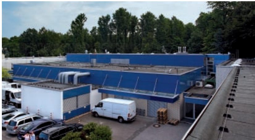
Die Dachlandschaft stammt aus den 1960er Jahren und wurde bereits häufiger ausgebessert.

Im nordrhein-westfälischen Hagen unterhält der DRK-Blutspendedienst West, eine gemeinnützige GmbH, das 1969 gegründete Zentrum für Transfusionsmedizin. Hier werden jährlich ca. 240.000 Vollblutkonserven von Blutspendern genommen. Die Einrichtungen des Blutspendedienstes sind in einem größeren Gebäudekomplex aus den 1960er/70er Jahren untergebracht, der von Flachdächern bedeckt wird. Im Sommer 2009 dichtete die Elflein Isolierbau GmbH eines der Dächer mit KEMPEROL® neu ab.