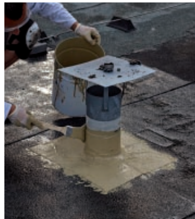
Verarbeitung im Detail: Die passgenauen Vliesstücke werden im KEMPEROL®-Eimer getränkt, aufgebracht und mit dem Pinsel nachgearbeitet.